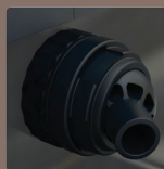
可调节的鱼缸内循环