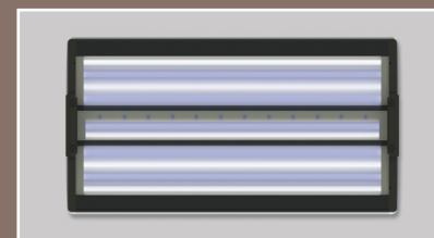
10 X T5 + 12 LED月光灯