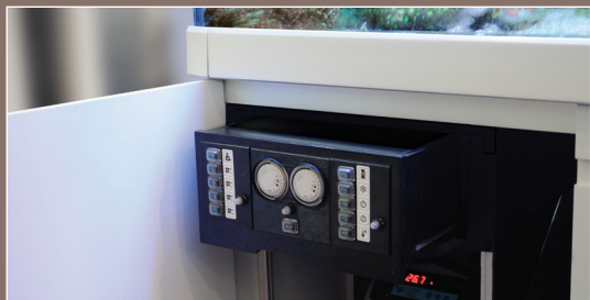
后视图（除去底柜背板后）

MAX S-系列的过滤系统沿用了MAX一插即用的概念和特点，为便于检修设置了10个独立开关分别控制所用水泵和其它设备，并设有安全跳闸装置。